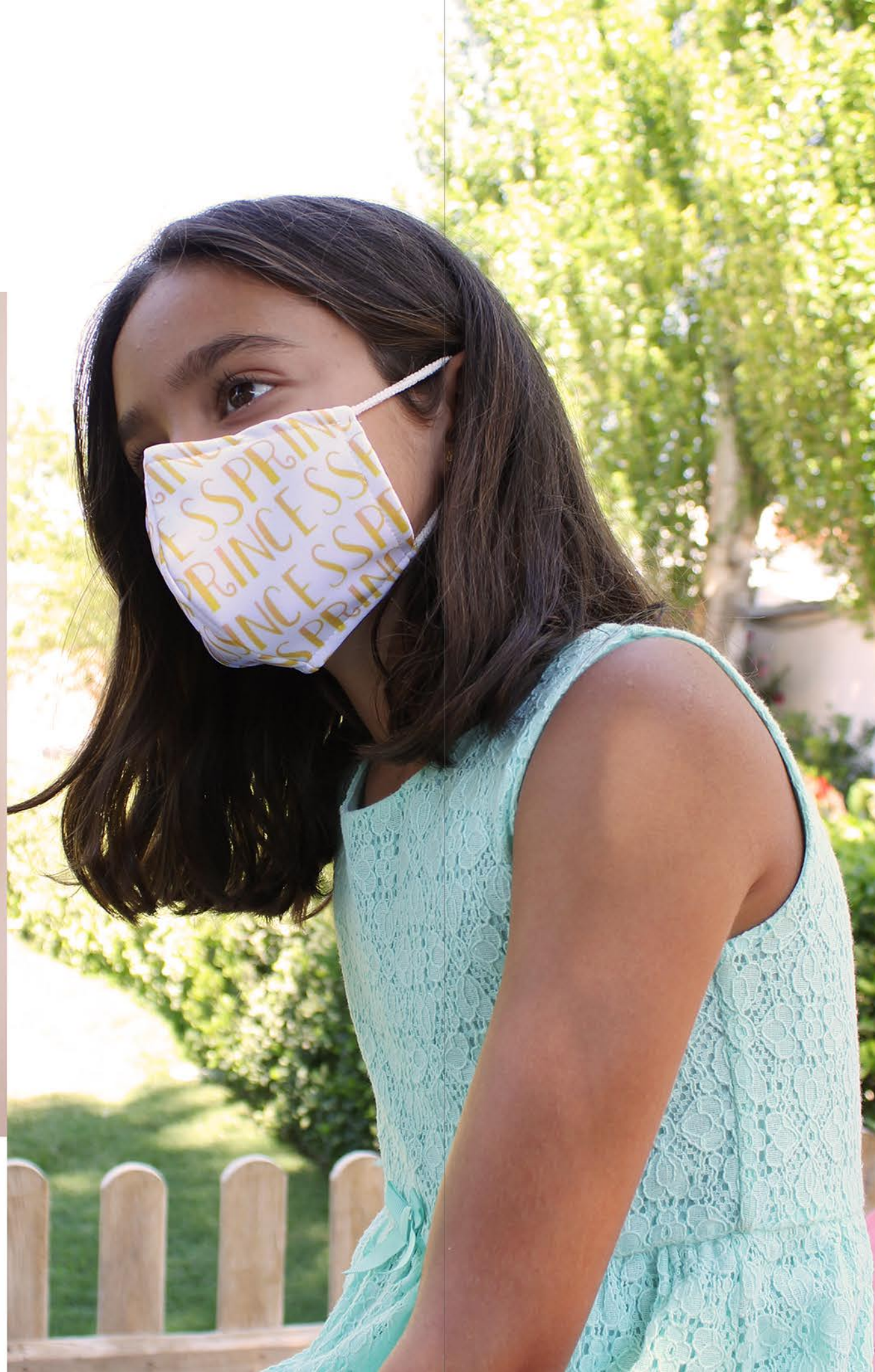
PT KEKO ESTRELLA 23 talla S