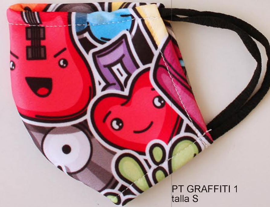
PT GRAFFITI 1 talla S