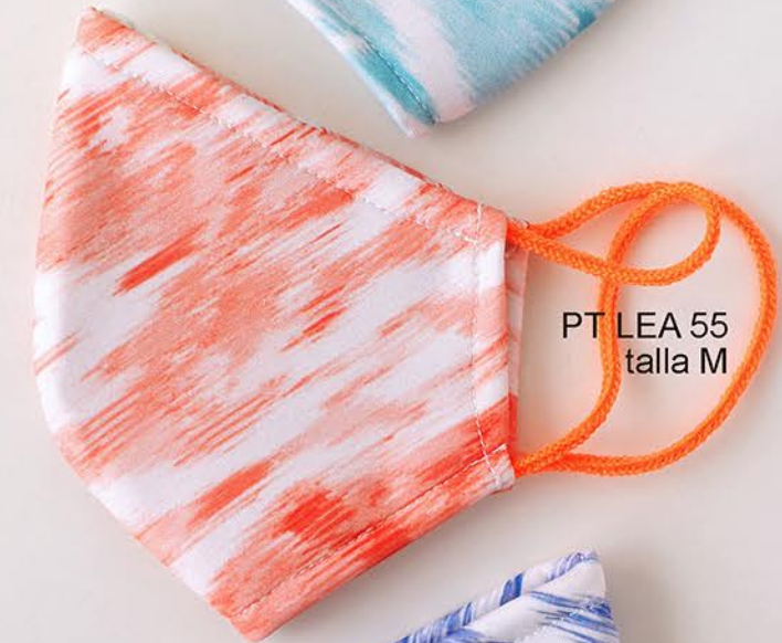
PT LEA 55 talla M