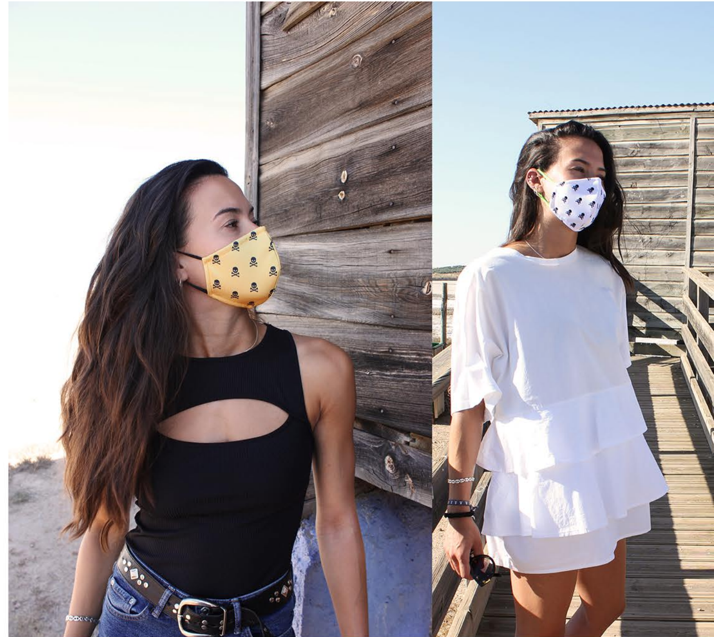
PT SKULL 7 talla M-L