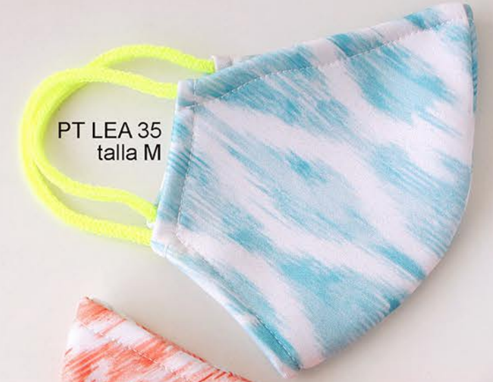
PT LEA 35 talla M