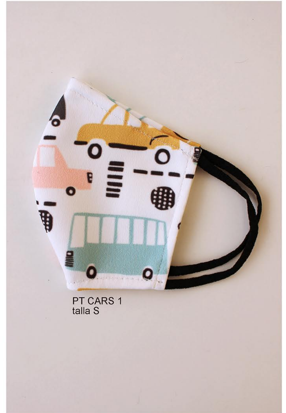
PT CARS 1 talla S