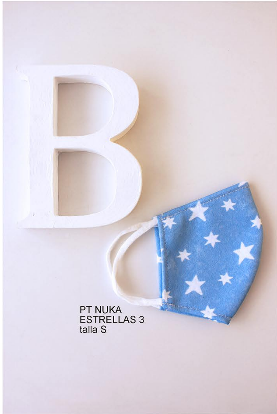
PT NUKA ESTRELLAS 3 talla S