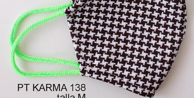
PT KARMA 138 talla M