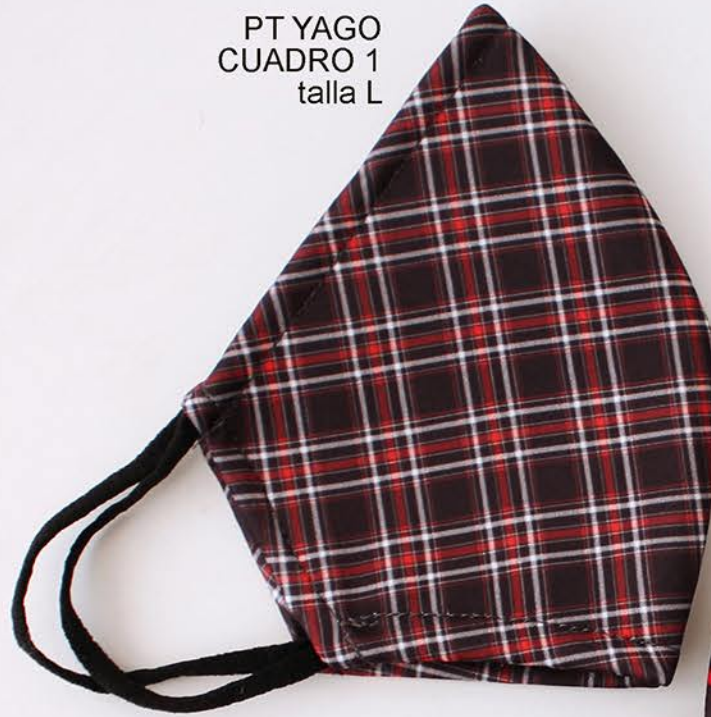
PT YAGO CUADRO 1 talla L

Mascarillas higiénicas reutilizable Certificadas UNE 0065:2020