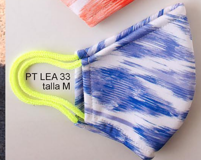
PT LEA 33 talla M