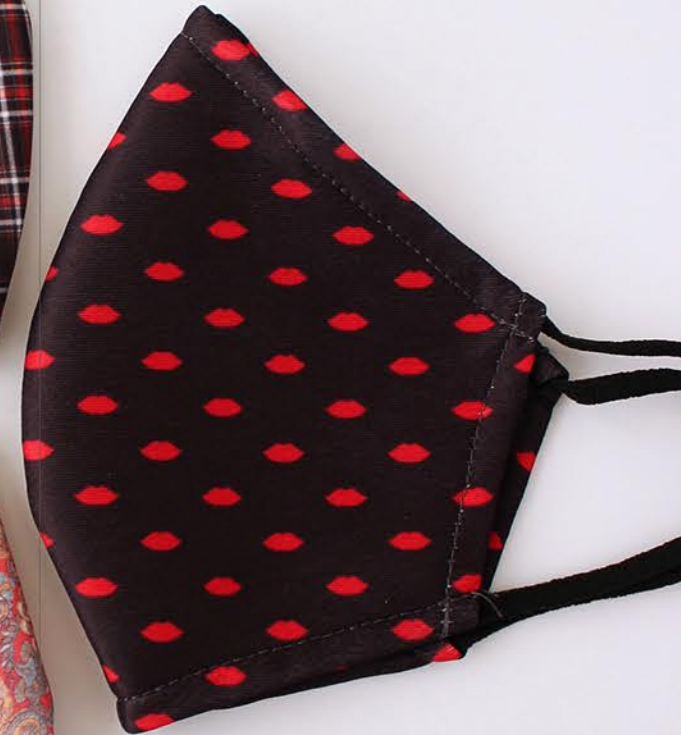
PT LIPS 38 talla M-L