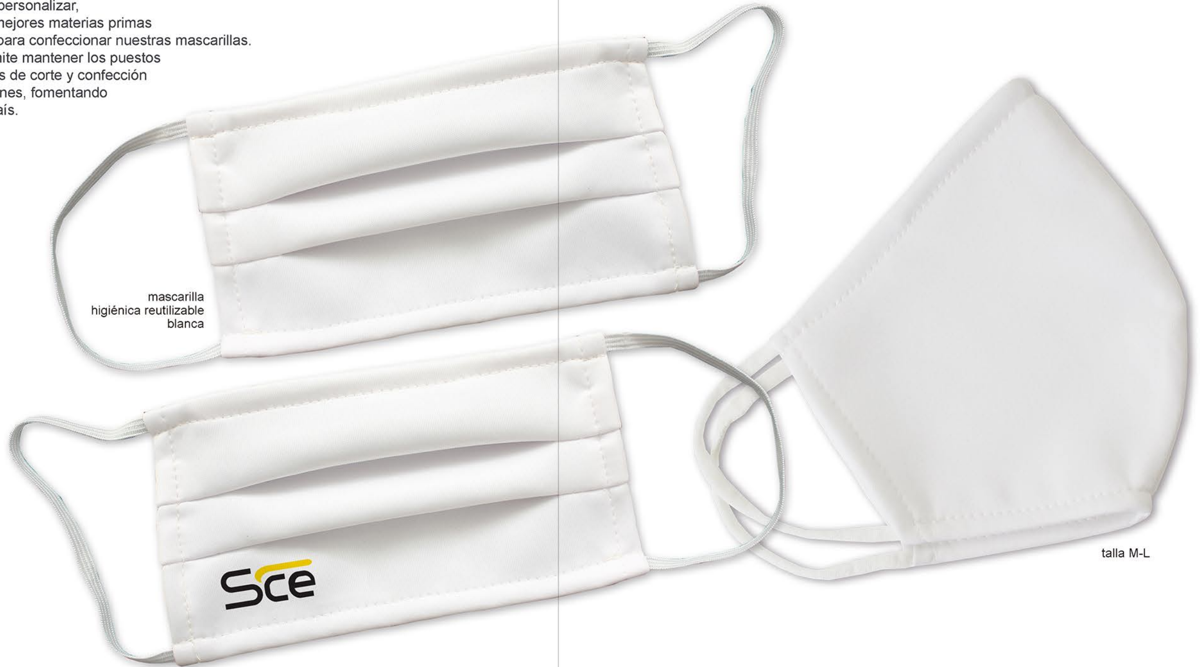
mascarilla higiénica reutilizable blanca

SCE ofrece soluciones y sistemas de protección, con el objetivo prioritario de mejorar el acceso de estos productos a la población y a las empresas que retomarán su actividad, ofreciendo la posibilidad de personalizar sus mascarillas , para ser utilizadas en las empresas que opten por poner su logotipo, y así proteger a sus empleados en sus puestos de trabajo, proveedores y clientes. Disponibles también si personalizar, en blanco, usando las mejores materias primas que ofrece el mercado para confeccionar nuestras mascarillas. Esta actividad nos permite mantener los puestos de trabajo de los talleres de corte y confección y de nuestras instalaciones, fomentando el empleo en nuestro país.