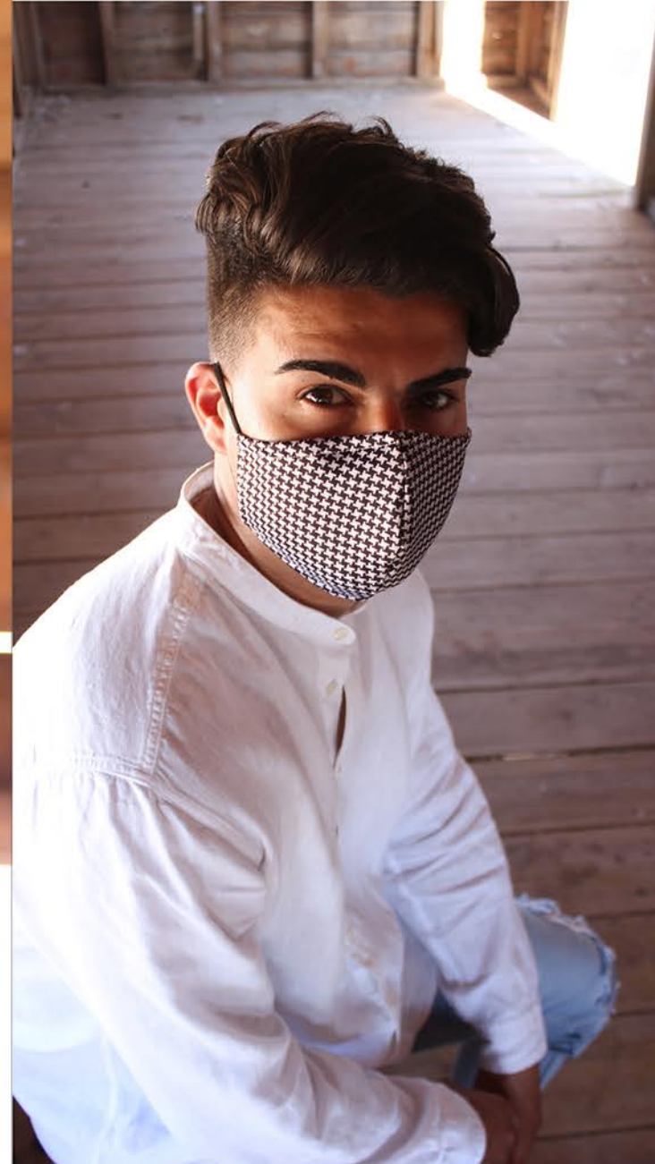
PT KARMA 138 talla L