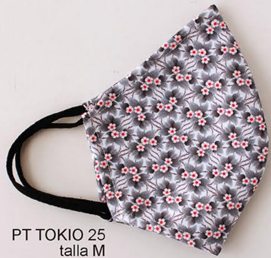
PT TOKIO 25 talla M