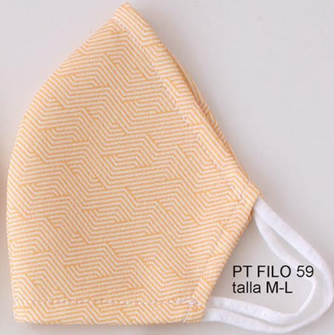
PT FILO 59 talla M-L