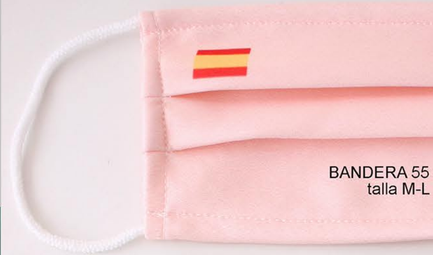
BANDERA 55 talla M-L