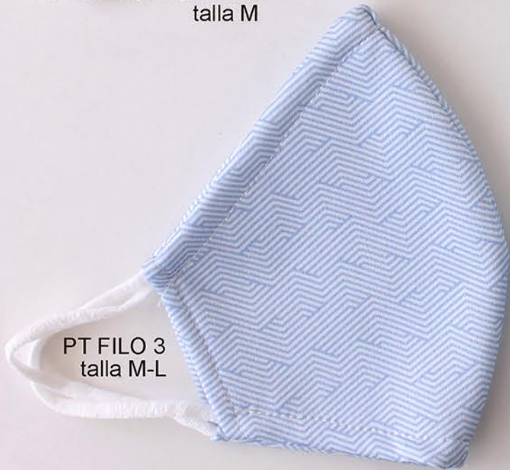
PT FILO 3 talla M-L