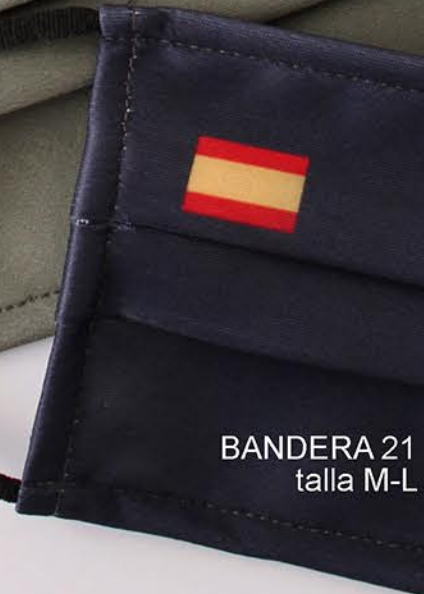
BANDERA 21 talla M-L