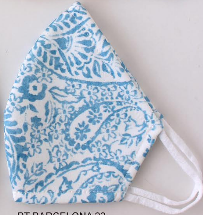
PT BARCELONA 23 talla M