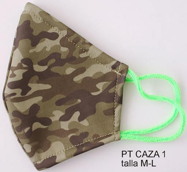
PT CAZA 1 talla M-L