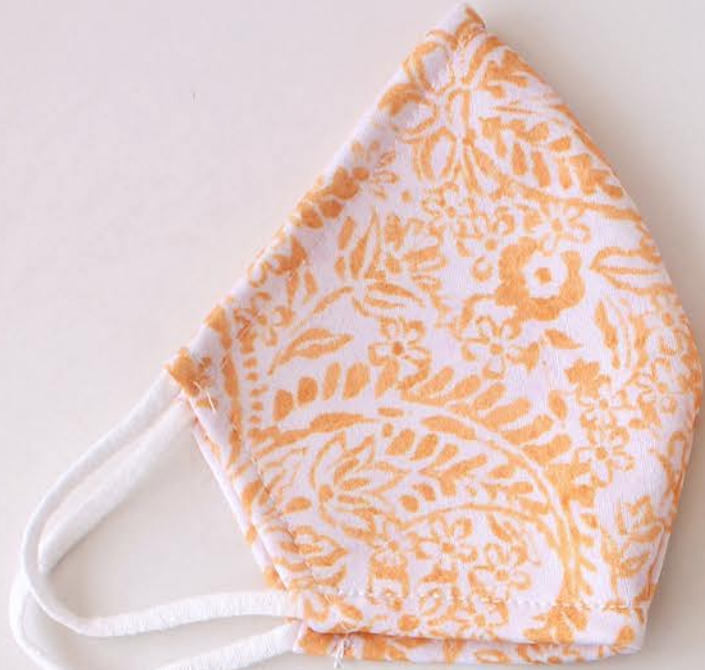
PT BARCELONA 59 talla M