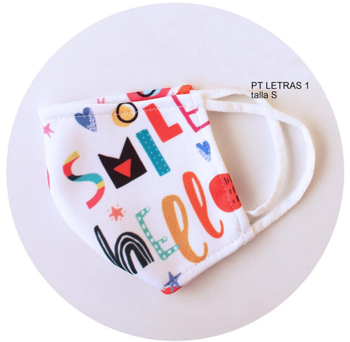
PT LETRAS 1 talla S