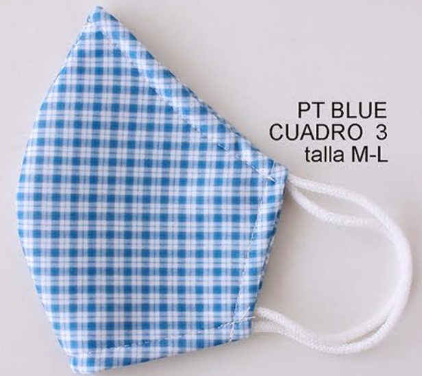
PT BLUE CUADRO 3 talla M-L