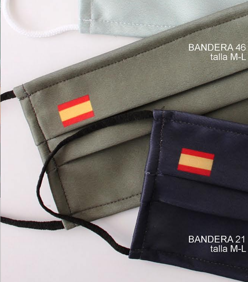
BANDERA 46 talla M-L