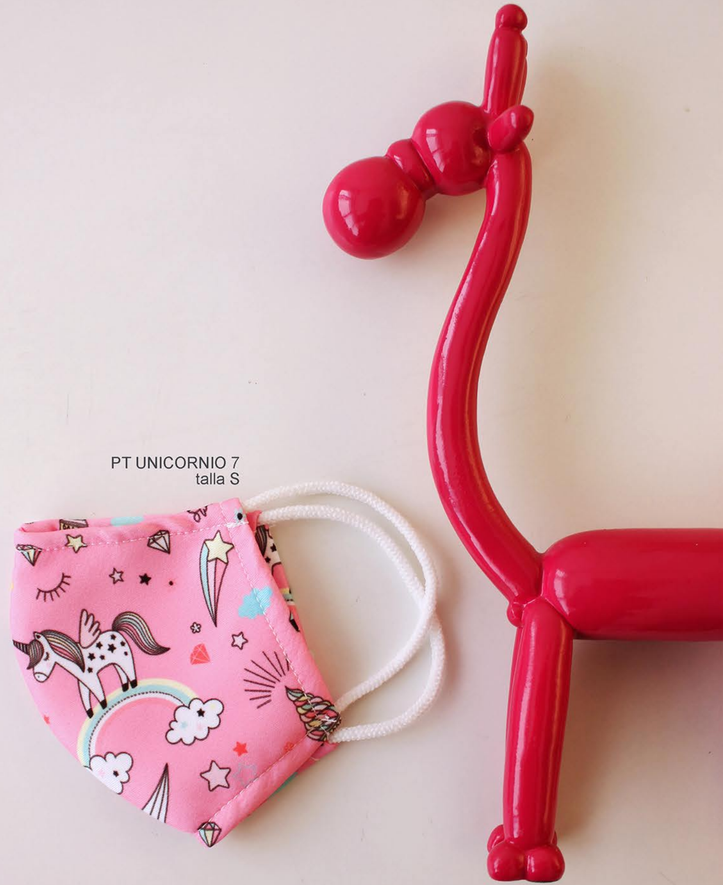
PT UNICORNIO 7 talla S