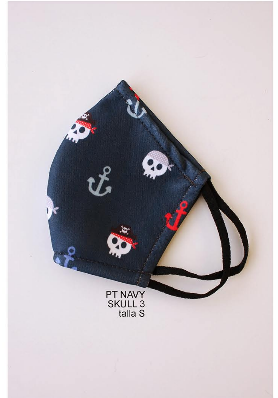
PT NAVY SKULL 3 talla S