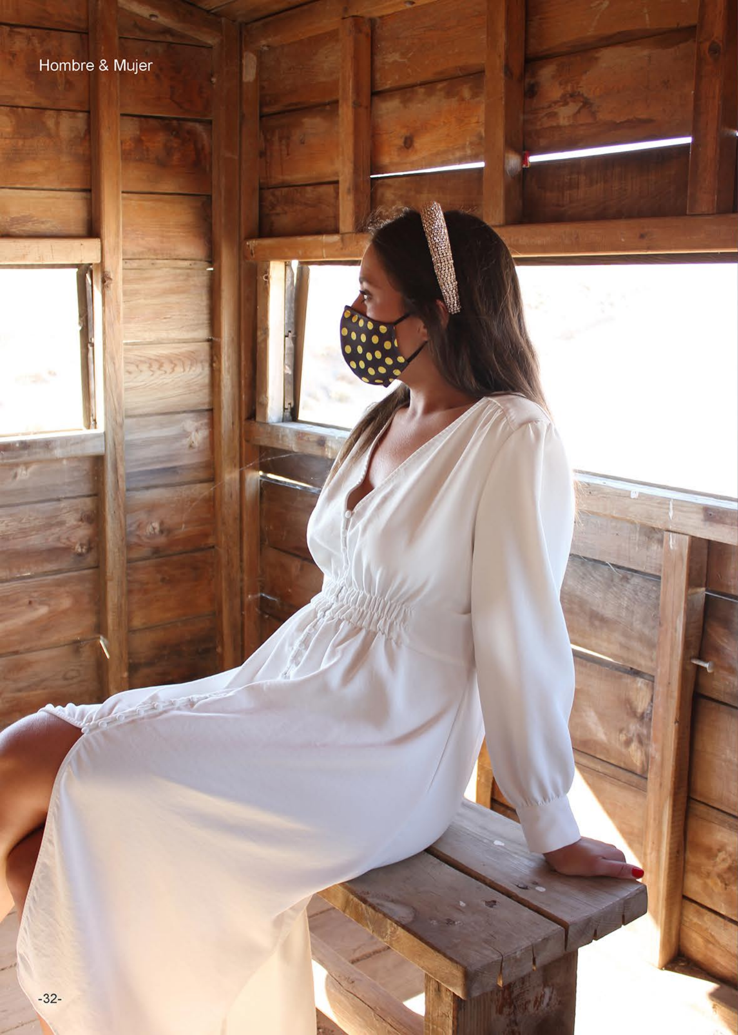
PT LOLA TOPOS 109 talla M