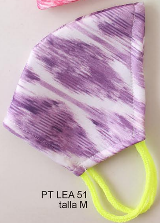
PT LEA 51 talla M