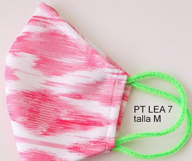
PT LEA 7 talla M