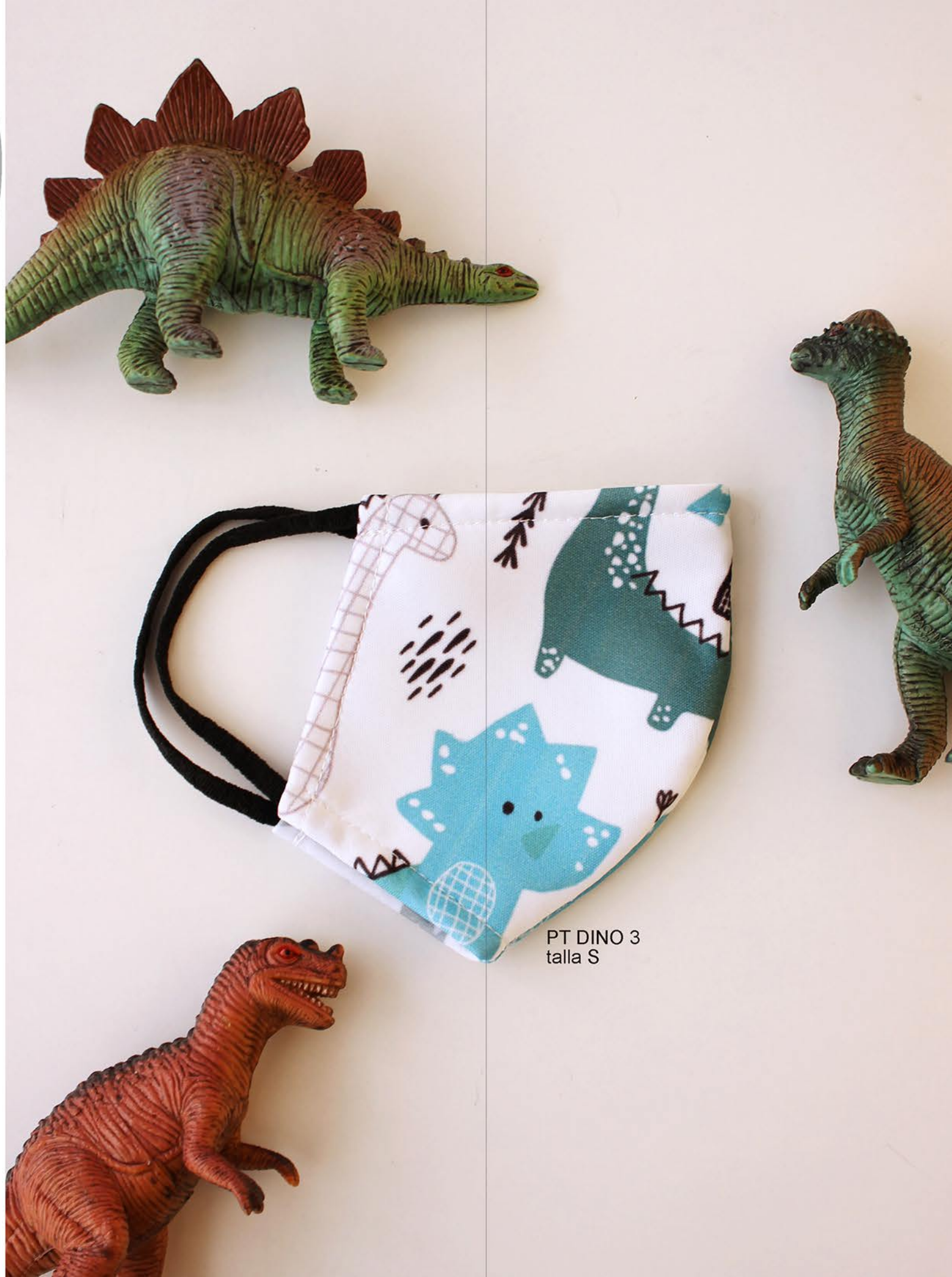
PT DINO 3 talla S