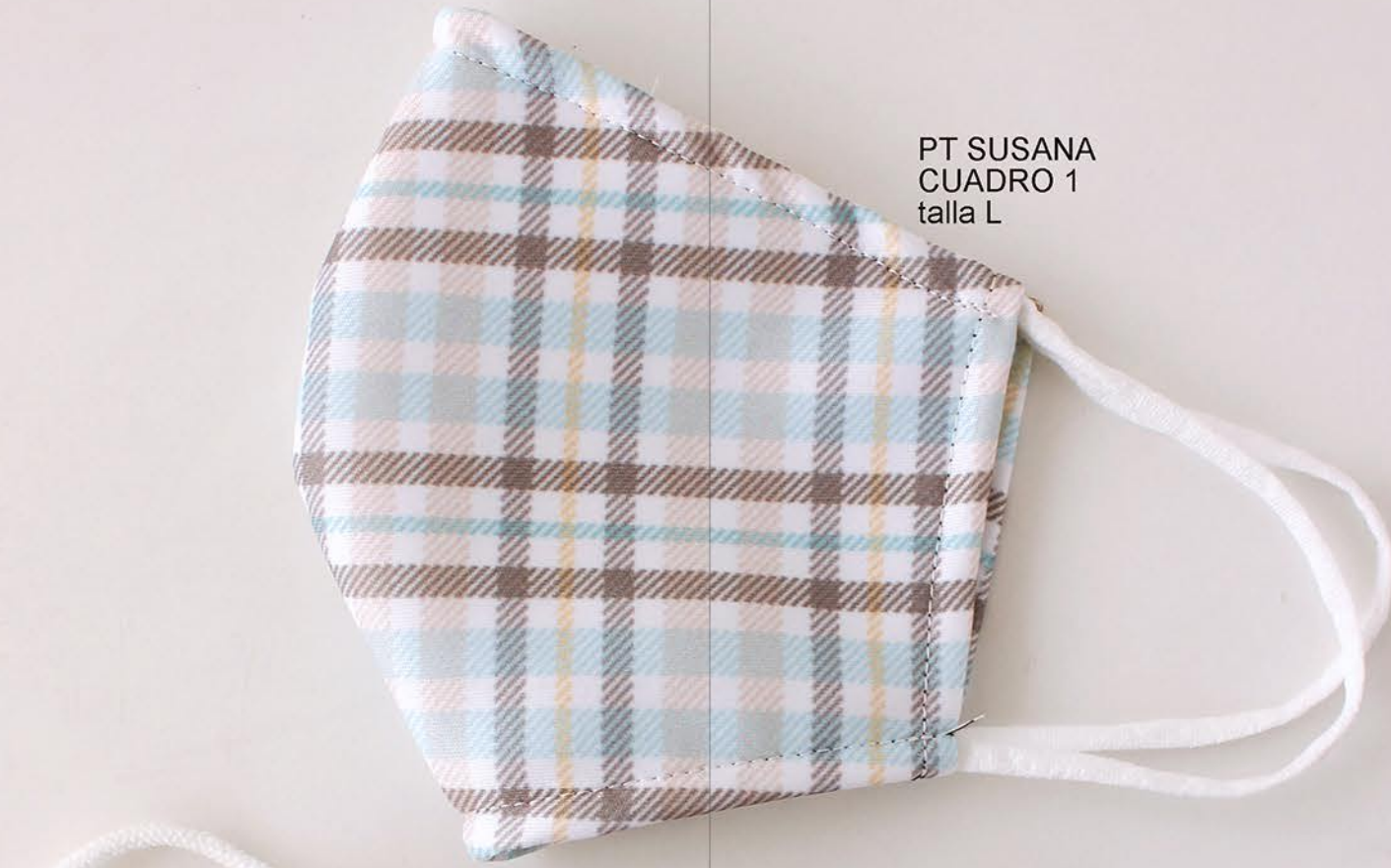
PT SUSANA CUADRO 1 talla L