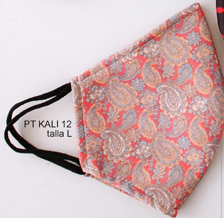
PT KALI 12 talla L