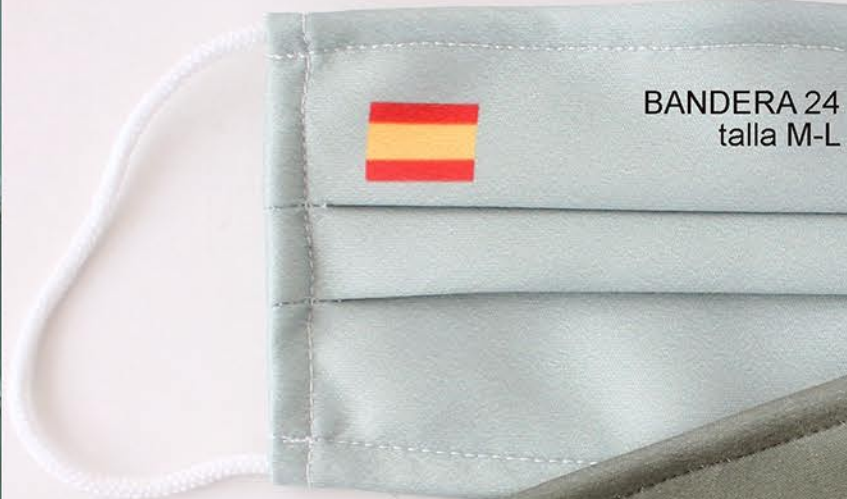
BANDERA 24 talla M-L