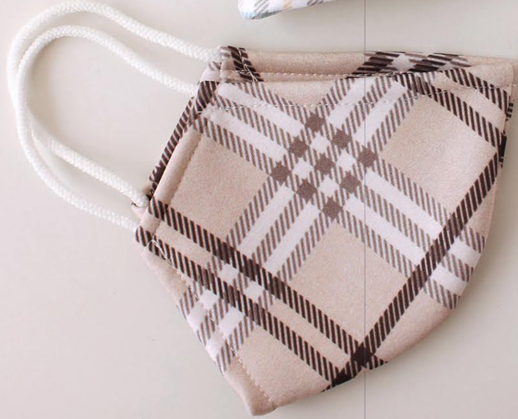
PT CUADRO 2 talla L