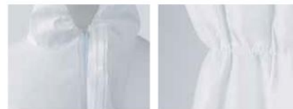
Two-way zipper with adhesive placket for added safety.

Cremallera bidireccional con solapa adhesiva para mayor seguridad. Cinturilla elástica para un ajuste perfecto.